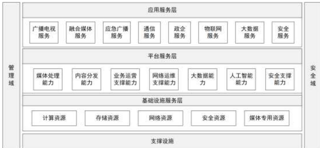
图 2 智慧广电有线网络服务云技术架构示意图

应用服务层可以对平台服务层各项能力协同管理和调用，将涉及的各类应用服务提供给对应的用户。